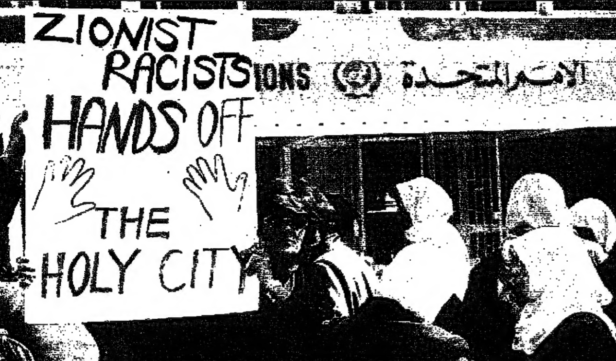
تساء يتظاهرون أمام مقر الأمم المتحدة في الأردن احتجاجاً على سياسة الاستيطان الاسرائيلية

تجدد علاقاتها مع اسرائيل احتجاجاً على قرار بناء حي يهودي جديد في القدس الشرقية. وقال المتحدث باسم وزارة الخارجية الفلسطينية ان اسرائيل لم تستجب لطلبها من وقف البناء في القدس الشرقية. وقال المتحدث باسم وزارة الخارجية الفلسطينية ان اسرائيل لم تستجب لطلبها من وقف البناء في القدس الشرقية.